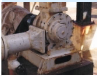
TRANSPORTE DE SOLIDOS RECUPERADOS (PAMA) DE AGUA DE BOMBEO A POZAS DE ALMACENAMIENTO