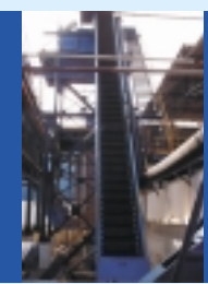
TRANSPORTE DE PESCADO DE POZAS DE ALMACENAMIENTO A COCINADORES