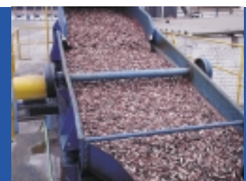
DESCARGA DE PESCADO DE CHATA (PONTON) A PLANTA